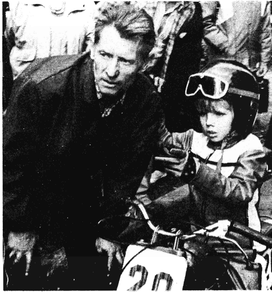
Каждый по-своему лето проводит.

Николай БУРБЫГА. («Известия».) (Окончание следует.)