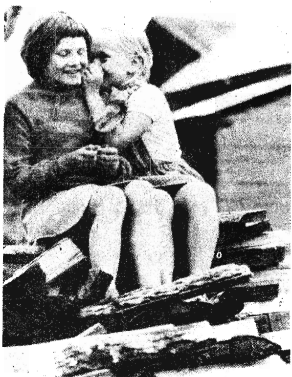
По секрету — всему свету.