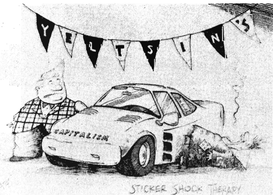
Неоднозначно на Западе относятся к экономической ситуации в России. Вот таким представляется переход к рыночным отношениям путем шоковой терапии.