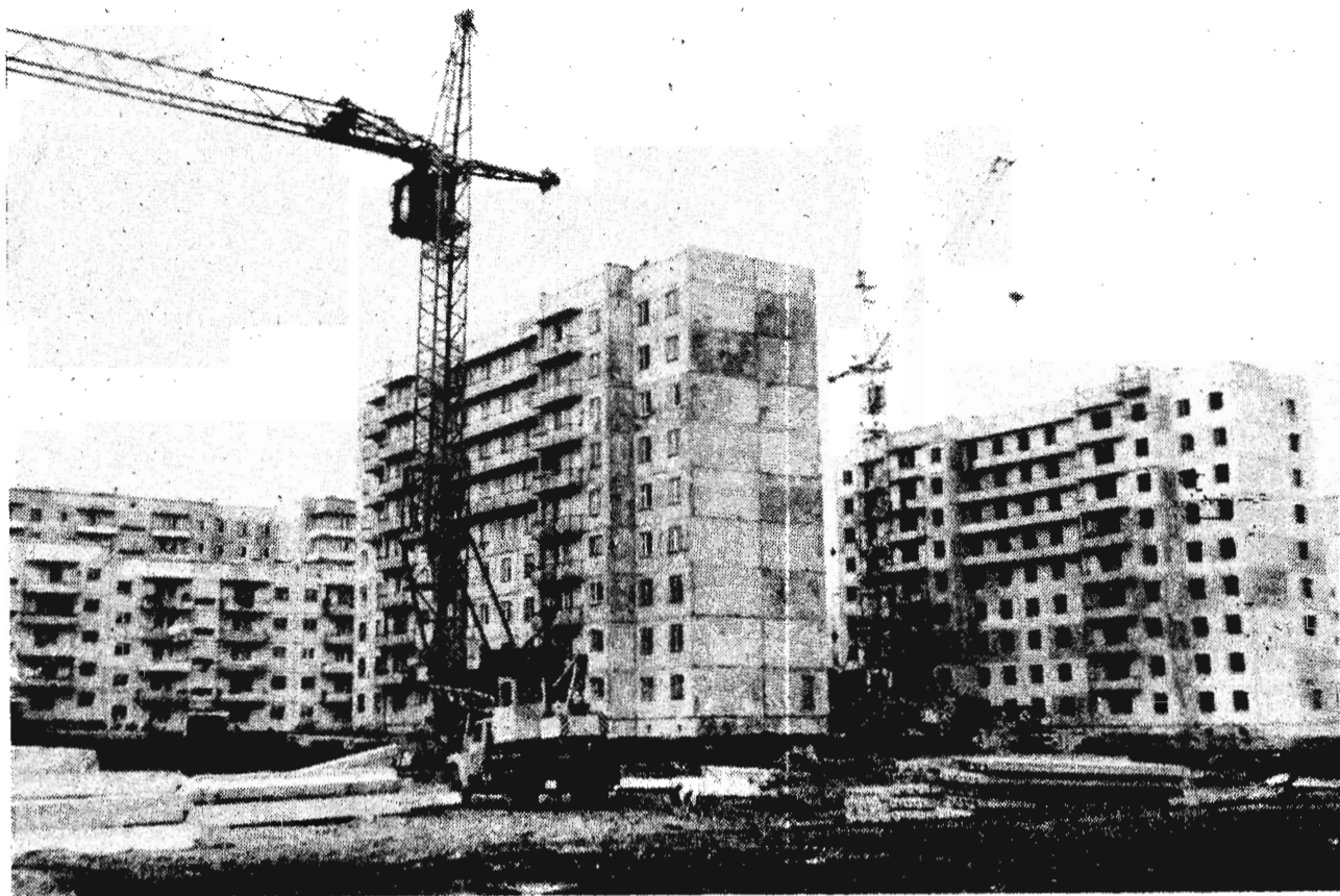
Город растет ввысь и вширь.