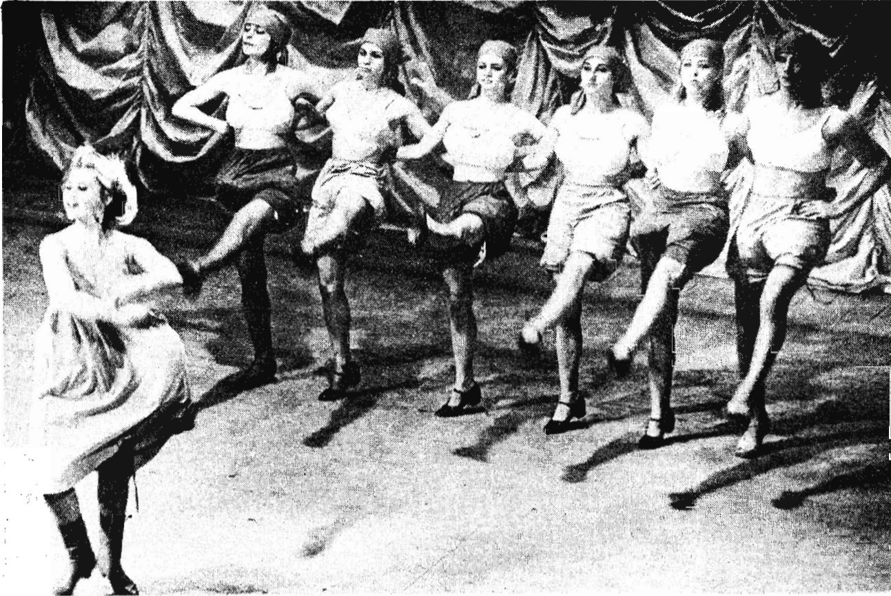
Ах кабаре, кабаре!