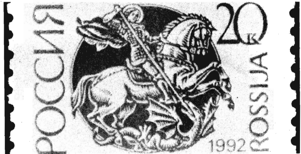
МОСКВА. В обращение поступили новые марки. Вместо «Почта СССР» на них стоит надпись «Россия».

Ю. НЕЗНАМОВ. Исполняющий обязанности главного инженера шахты «Комсомолец».