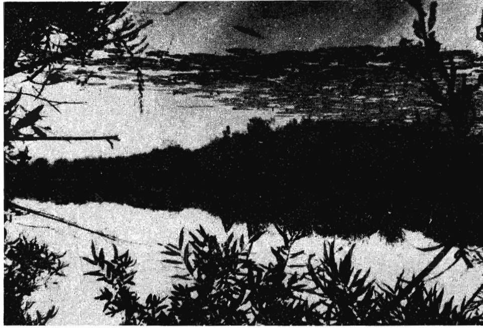
Ни дуновения, ни волны.

В минувшую субботу на стадионе шахты "Комсомолец" состоялся футбольный турнир, посвященный Дню физкультурника. Первое место заняла команда "Юность" (тренер А. Макаров). Второе — у футболистов шахты "Октябрьская" (тренер Н. Мухаметшин), на третьем месте — ребята из горного техникума (тренер Н. Пермяков). Итог этого соревнования закономерный, ведь главные конкуренты "Юности" на звание сильнейшей городской команды — футболисты шахты "Кузнецкая" — участия в турнире не приняли. А зря. У чемпиона турнира праздник на этом не закончился. В кафе спорткомплекса "Юность" прошел торжественный вечер, где руководство шахты "Комсомолец" премировало памятными сувенирами особо отличившихся спортсменов и работников спорткомплекса. Праздник, он и у спортсменов праздник. Р. НИКОЛИН.