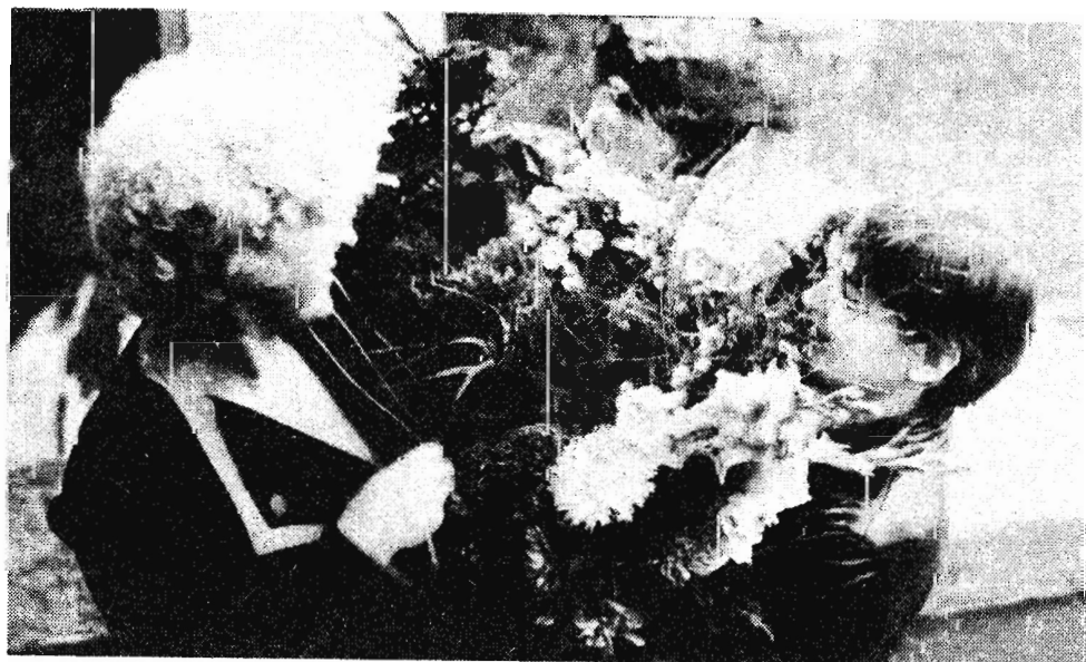
Целое море цветов...