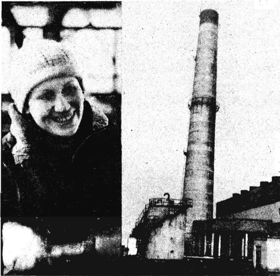
Оно выполнило основную долю работ из подразделения треста. Но и другие не остались в стороне, вложив свой труд в возведение фабрики теп-

строители Ленинской ПМК. Польсаевского стройуправления ЛСУ-3. Были задействованы даже работники аппарата треста. Кстати, позволю по этому поводу небольшое отступление. Многие сейчас ратуют за самостоятельность. Конечно, с одной стороны, это неплохо. А вот сколько бы стоило усилий скоординировать и привлечь к работе столько самостоятельных организаций? Кучи бумаги пришлось бы извести на писанину согласований и договоров. Но это сугубо личное мнение.