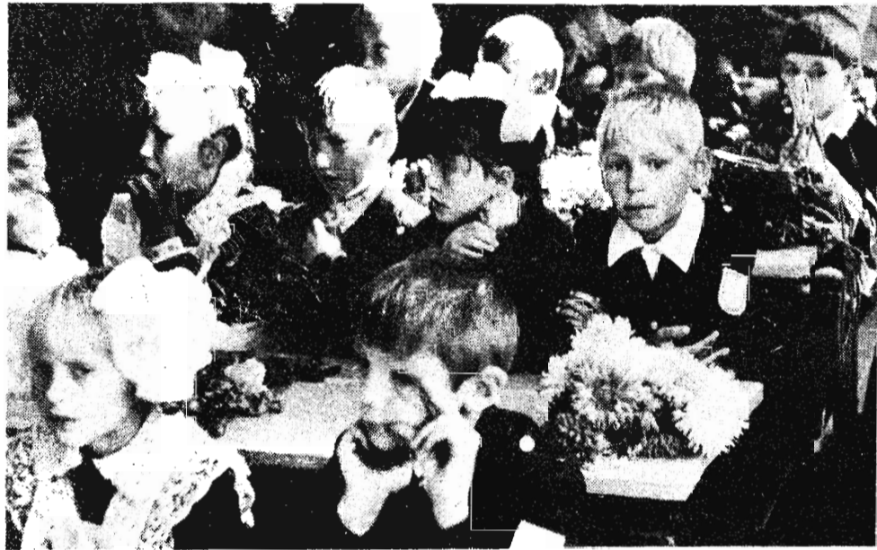
Слушая любимую учительницу...