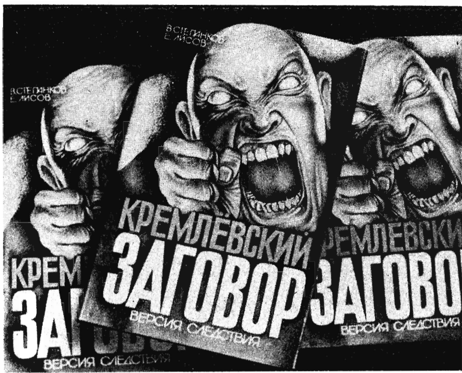
ВЫХОДИТ НОВАЯ КНИГА

Провел интервью Д. ГАЙМАКОВ. (РИА «Новости»).