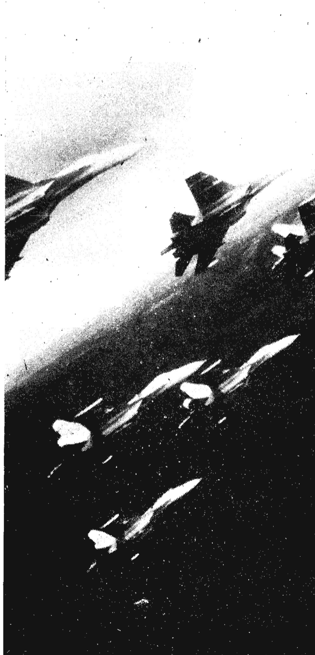
Зеленое море тайги...

17 октября в районной остановке «Детская поликлиника», по ул. Горького, потерялась собака, болонка, белая, четыре года. Нашедшего просим сообщить за вознаграждение по телефону 4-23-46.