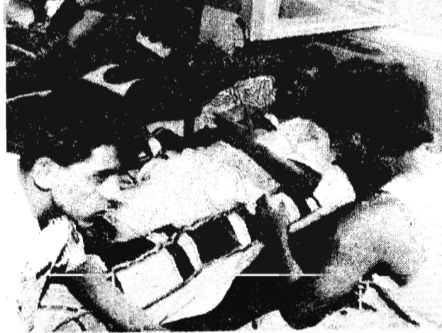
К событиям в Таджикистане

Сохраняется напряженная обстановка в Таджикистане. Продолжаются бои между сторонниками президента и оппозицией.