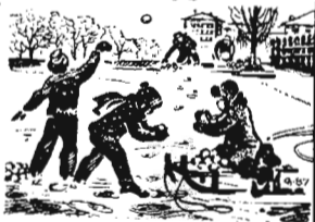
Зимние этюды.