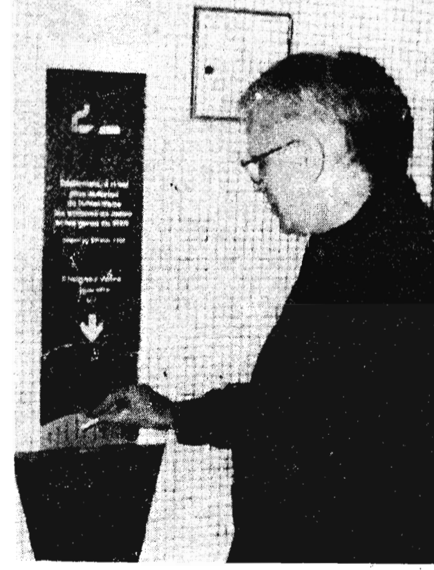
Париж. С 1 ноября вступили в силу законодательные нормы, запрещающие курение в общественных местах. Действие правительственного декрета распространяется на предприятия и учреждения, больницы и учебные заведения, общественный транспорт, бары и рестораны. Короче говоря, на все «места для общественного пользования».