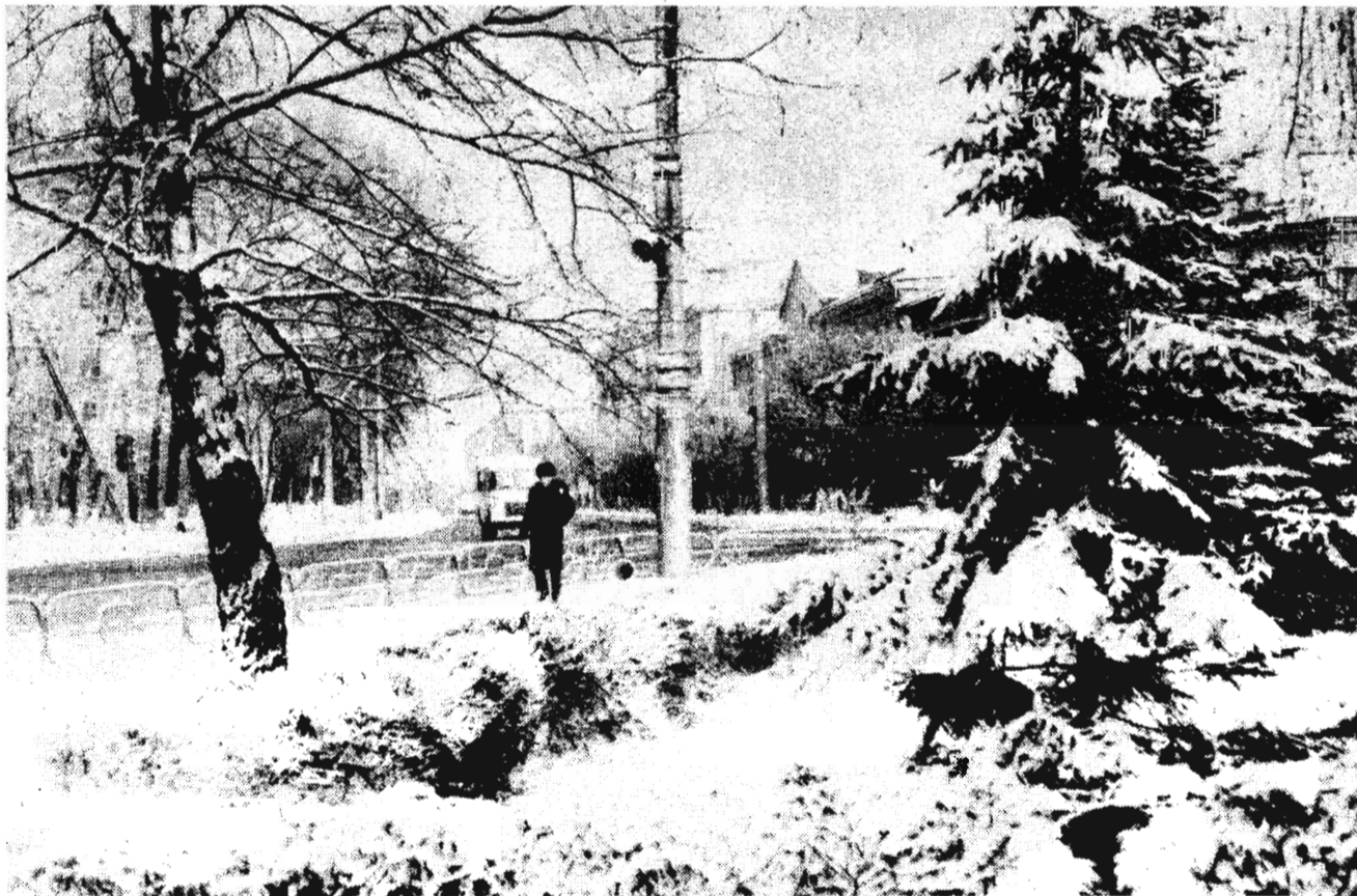
Уголки родного города.

25 ноября, в среду, в группы «Парус». Начало в 15.30. Помещение редакции газеты «Ленинский шахтер» состоится очередное занятие литературной лагуне. Приглашаются все желающие.