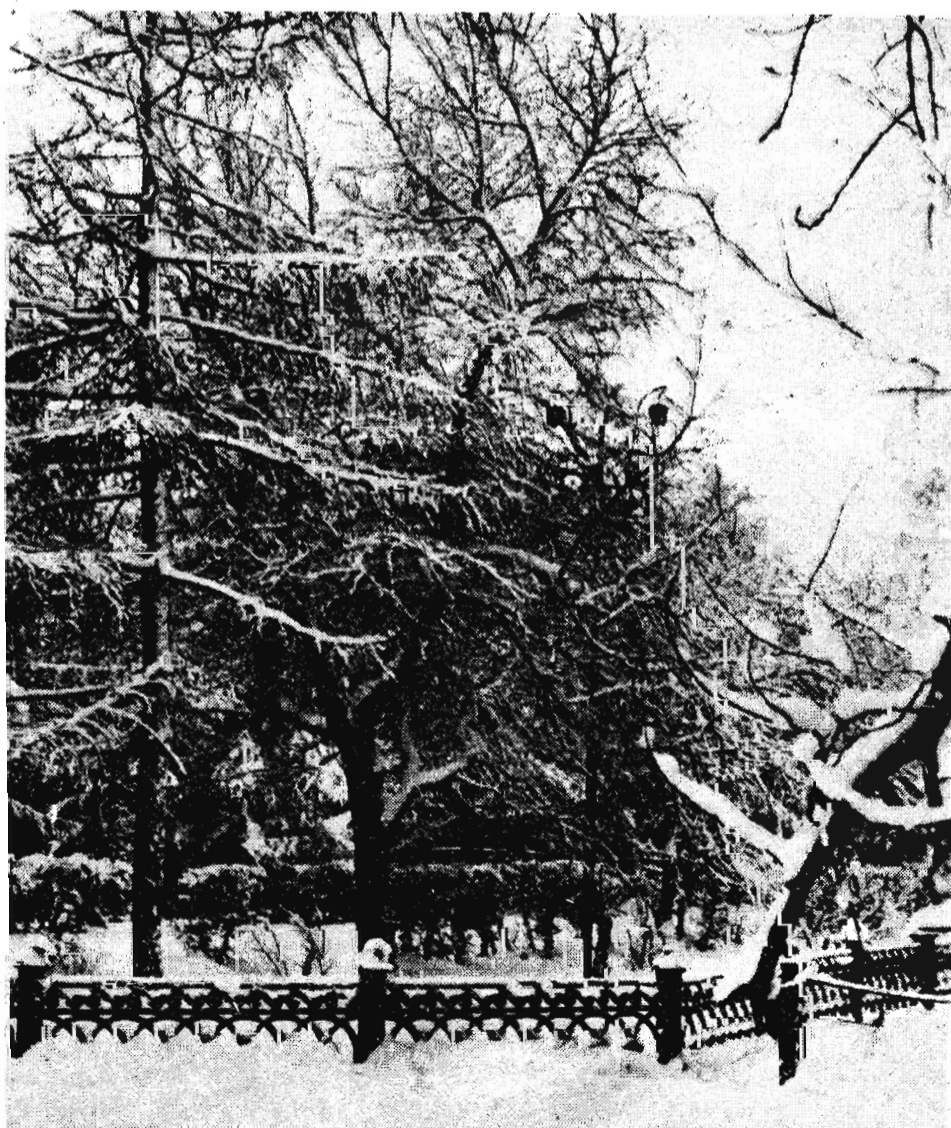
Из серии „Уголки родного города“

ПОДПИСКА ПРИНИМАЕТСЯ В ОТДЕЛЕНИЯХ СВЯЗИ ПО МЕСТУ ЖИТЕЛЬСТВА ДО 15 ДЕКАБРЯ.