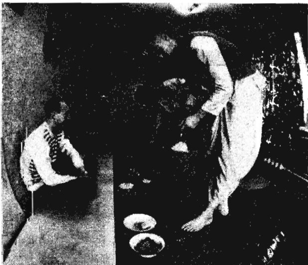
На снимке: по распорядку дня — обед.

Интервью взяла Е. МОЛОТОВА. Внештатный корреспондент.