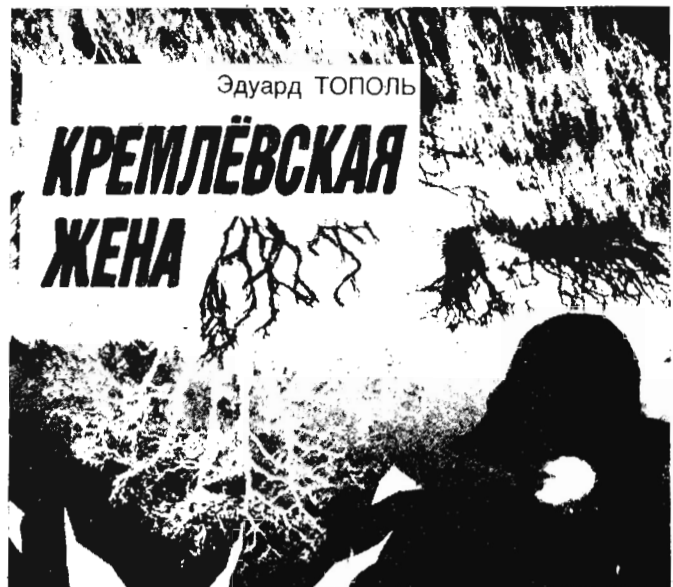
Эдуард ТОПОЛЬ КРЕМЛЁВСКАЯ ЖЕНА