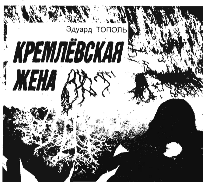
(Начало в № 17—20, 22—25, 27—30, 32, 33).

Я знала, что сейчас будет, и, спасаясь, покатила, не вставая, в сторону, в кусты. Но не успела — эти парни, его коллеги, уже засекли неудачу своего дружка и с двух сторон ринулись ко мне. Я вскопала, чтобы встретить их лицом, точнее — криком: