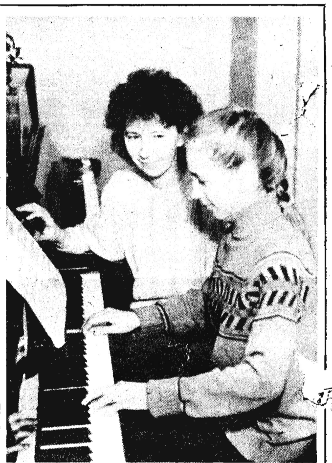
К юбилею музыкальной школы

Многие преподаватели музыкальной школы когда-то робкими ученицами переступили ее порог и несмело приступили к изучению нотной грамоты, удивленно входили в чарующий мир звуков. Входили робко, но прочно и навсегда наполнила их музыка.