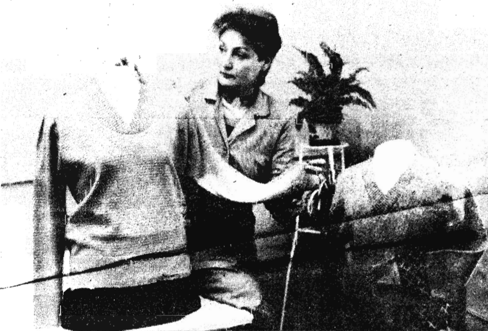
приятый составляет около двух тысяч рублей. На снимке: конструктор

в прошлом году было организовано экспертно-аналитическое производственное малое предприятие «Ремо», а также малое предприятие «Кифлекс» по изготовлению из отходов прядильного производства нетканых материалов. Эти мероприятия позволили увеличить прибыль в пять раз за один год. Сейчас средняя заработная плата на пред-