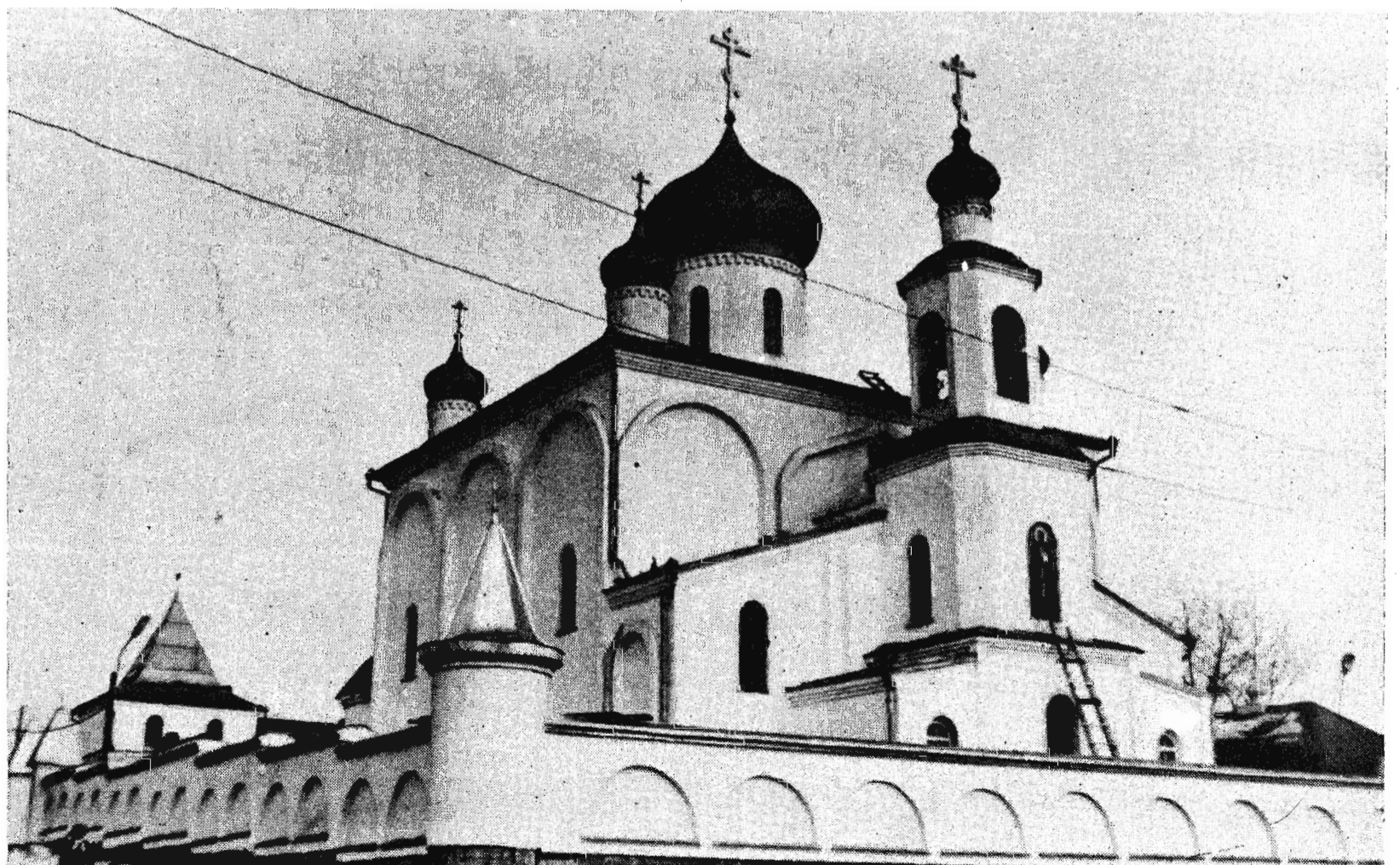
Покровская церковь. Ленинск-Кузнецкий.

Просим посетить наше ателье по адресу: пр. Кирова, 21, телефон для справки 2-05-11.