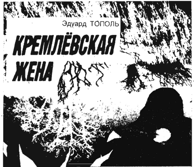
(Продолжение. Начало в № 17).