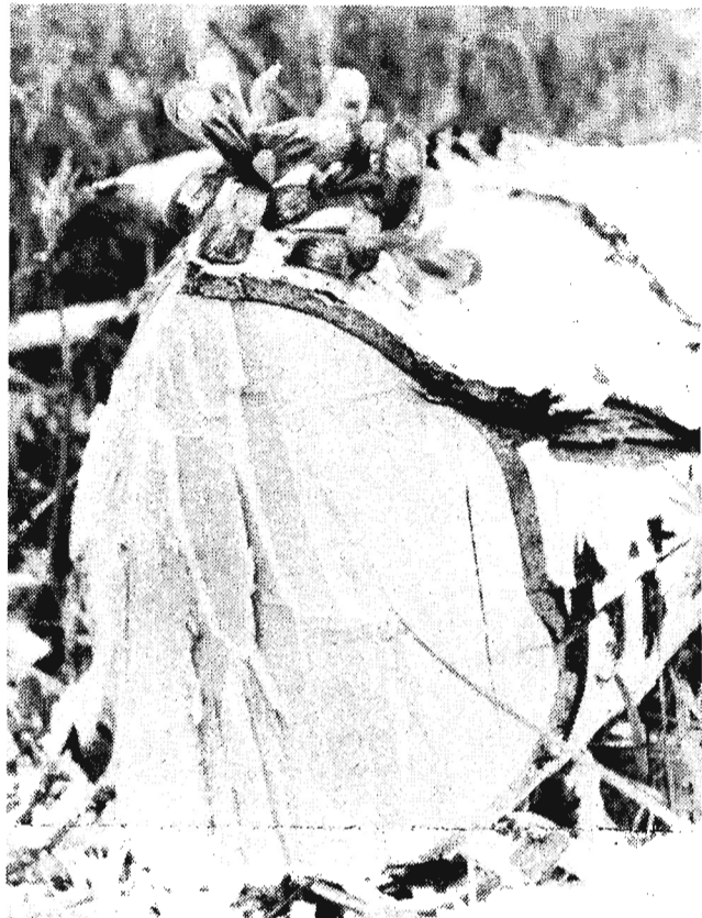
Кукушкины слезки