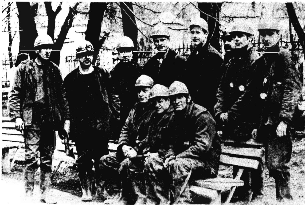
С опережением графика работ трудятся в июне на шахте имени Кирова проходчики подготовительного участка № 13. С начала месяца ими пройдено 70 метров горных выработок при плане 63 метра.