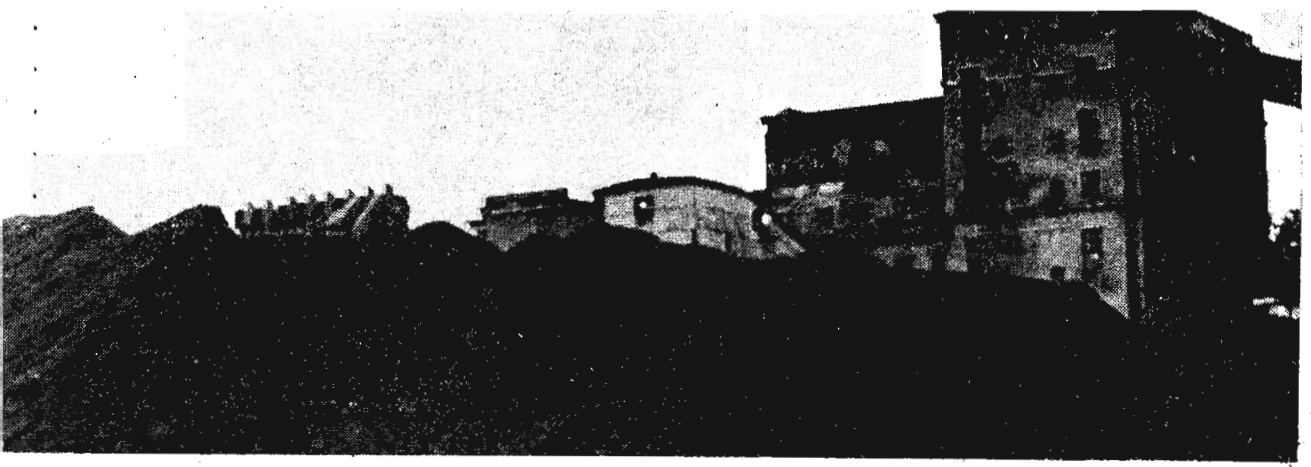
На складах шахт скопилось сотни тысяч тонн потем добытого «черного золота», которое под воздействием солнца и дождя возгорает или приходит в