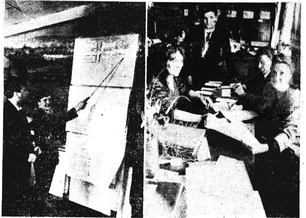
На снимках: идет защита дипломных проектов.