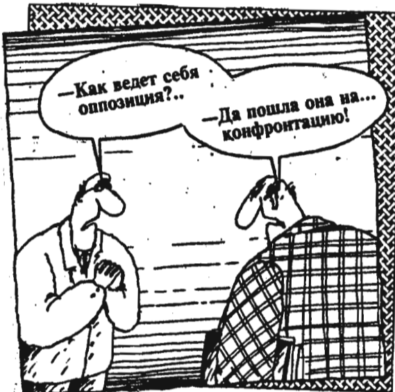
Рисунок В. ШИЛОВА.

А чтобы отвлечь внимание граждан, и был устроен этот грандиозный спектакль. «Непримле-