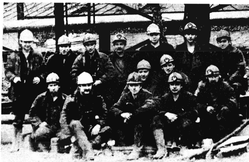
Стабильно работает в этом году кол-лугодне сверхплановый счет добычи топлива очистного участка № 5 шахты лива составил 37,7 тысячи тонн. Горняки из месяца в месяц досрочно выполняют поставленные им очистники и июль. За первую неделю перед ними задачи. Так, к примеру, в добыто 6159 тонн угля, что больше прошедшем месяце коллективом добыто плана. На снимке: горняки участка № 5.