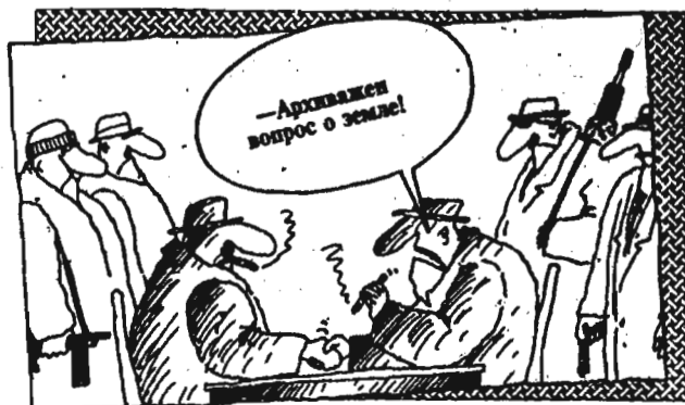
Рисунок В. ШИЛОВА.