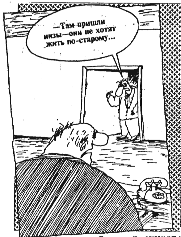
Рисунок В. ШИЛОВА.