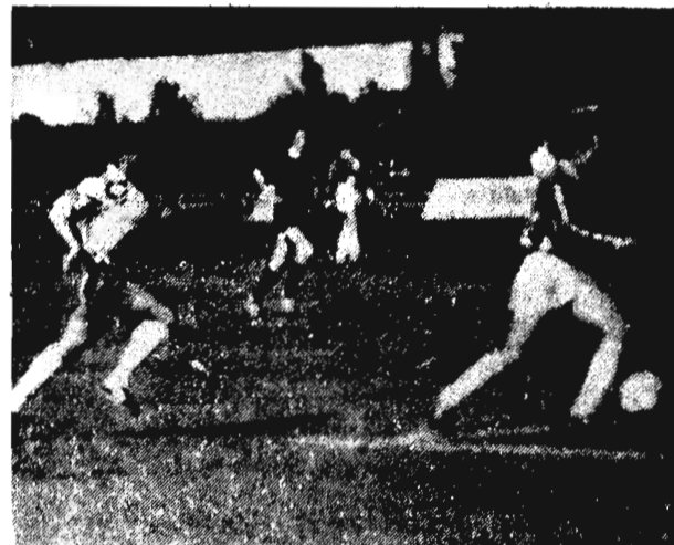
Сейчас достану...