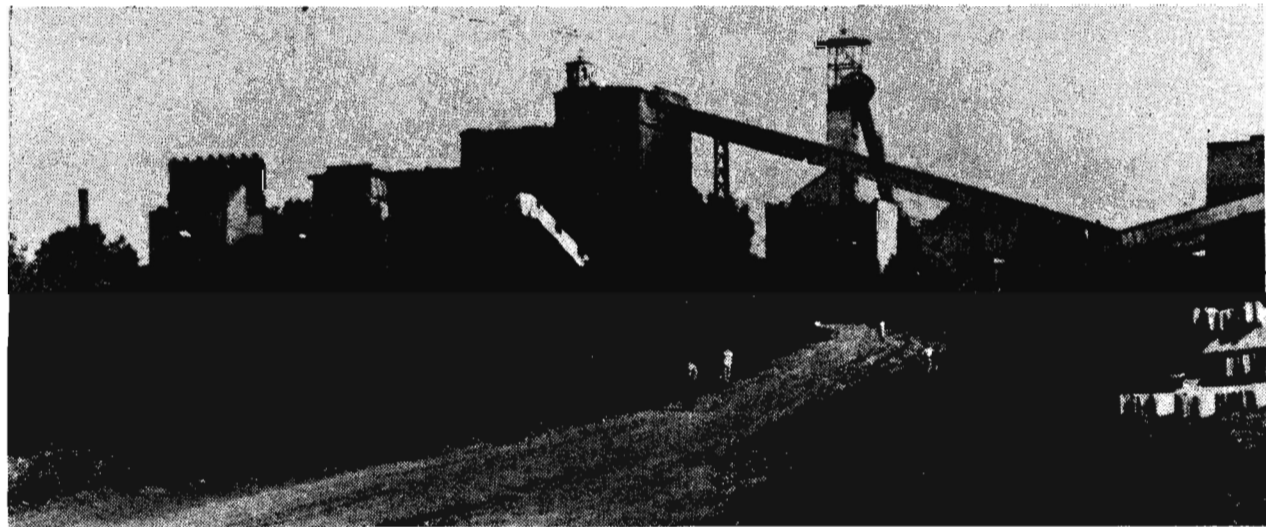
Рынок: проблемы, решения

подготовке площадей для установки более совершенных и производительных углелеперерабатывающих агрегатов, строительству модуля, где размещаются строительный и механический цеха, ремонту действующих корпусов и зданий, а также многое другое.