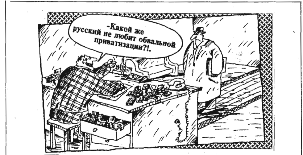
Рисунок В. ШИЛОВА.

Особенно критикой идеи «народного капитализма» и выкупа госпредприятий в собственность трудовых коллективов (призывали работников не выкупать акции собственных предприятий) занимались профсоюзы Англии и Франции. Это объяснялось тем, что мелкие акционеры никогда не смогут оказать решающего воздействия на процесс принятия управленческих решений, и что правительство заинтересовано лишь в привлечении их сбережений.