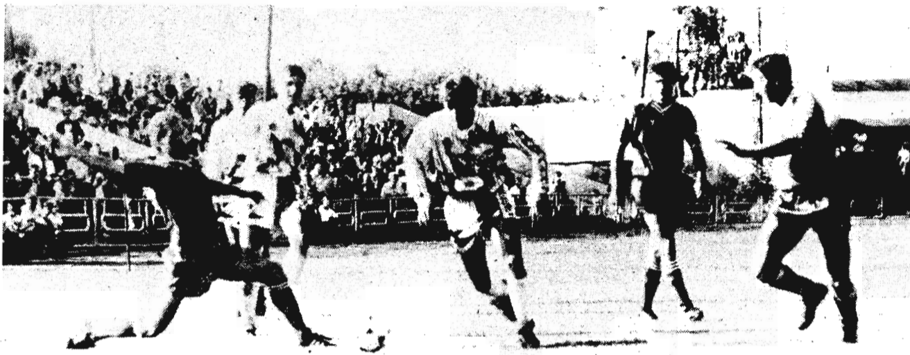
В атаке «Заря»

Газета профессионального футбольного клуба „Заря“