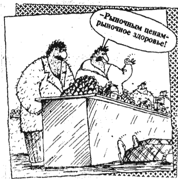
Рисунок В. ШИЛОВА.

тия множества мастеров, описанных историками и писателями, контор и лавчонок. Образование четырех ремонтно-строительных предприятий только в центре города образовало до головок окружения, которое кончилось сразу же после знакомства с ними. Оказалось, что все они, в действительности, специализируются на ремонте, но... берут заказы только у крупных промышленных предприятий. Для частного-собственнических интересов, к коим отнесли мои по изготовлению двери, ремонту окон, врезки замков и т. д., у контор не оказалось ни материала, ни исполнителей, ни, само собой, основного желания.