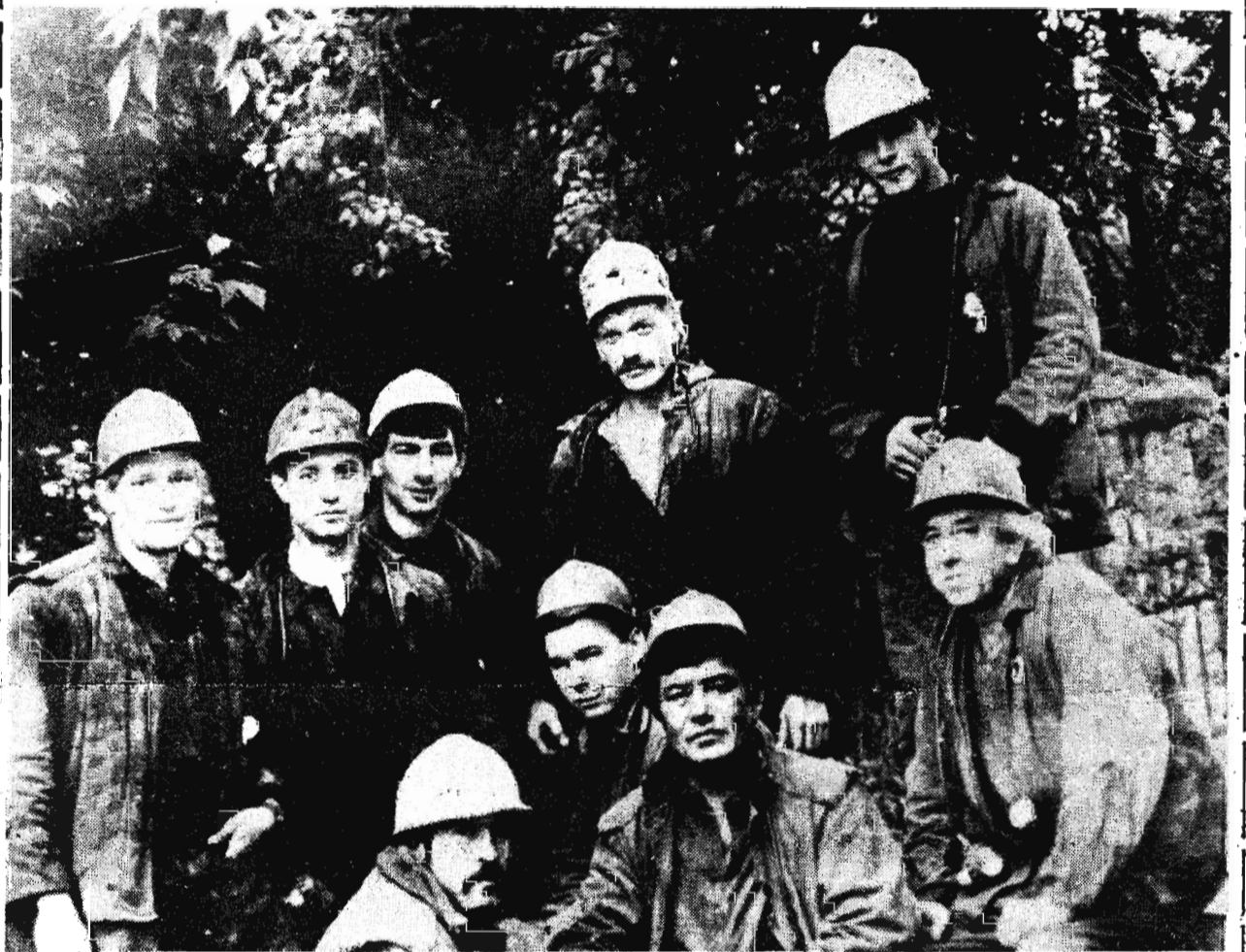
Хорошими показателями в труде встречают свой профессиональный праздник. День шахтера, горняки очистного участка № 1 шахты имени Кирова. За 23 дня августа они добыли 24,5 тысячи тонн

Прекрасный артист, прекрасный спектакль. Уверен, что Ян Арлазоров оставил своим выступлением приятное впечатление у всех зрителей, которое сохранится у многих не на один день. А. КОСТИН.