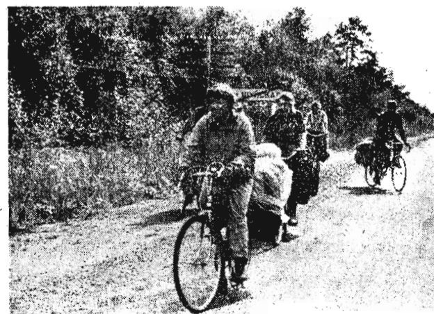
Несмотря на дождливое лето, в Карелии на отдых приезжает много людей, желающих полюбоваться красотами этого удивительного северного края. На снимке: по Центральной Карелии колесят на велосипедах москвичи.