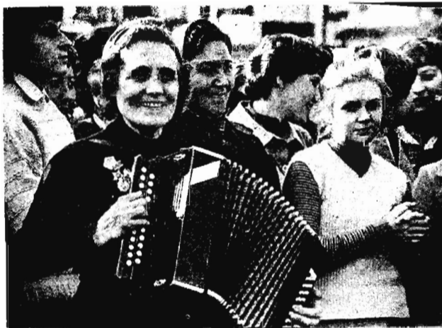
Играй гармонь...