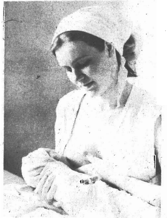
Человек родился...