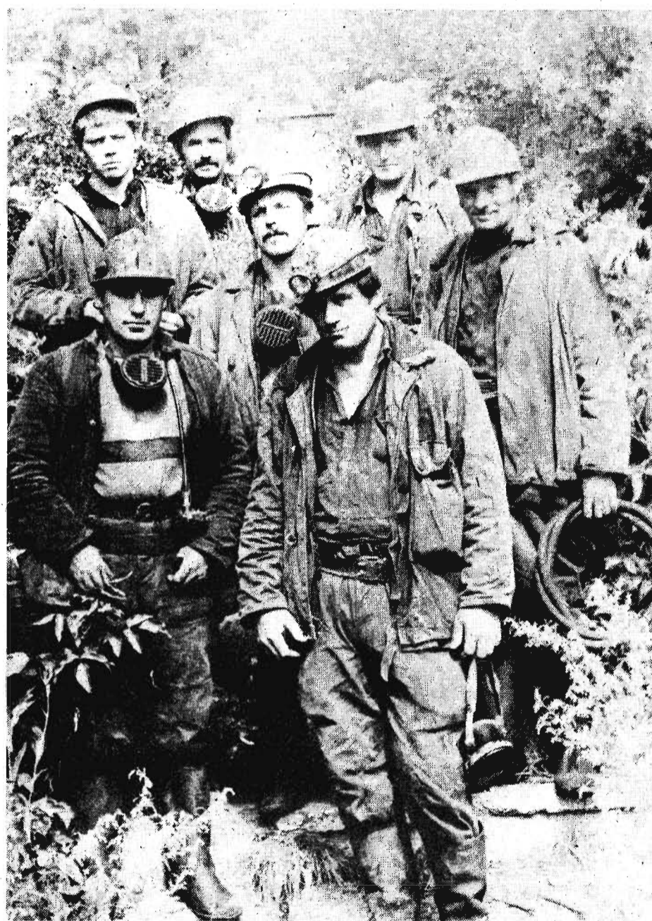
Успешно поработал в августе коллектив очистного участка № 6 шахты несколько сот тонн угля. Хороший старт «Комсомолец», руководимый ветераном взят горняками и в сентябре. На снимке: горняки участка № 6. Месячный план коллектив выполнил досрочно, выдав на-гора сверх плана.