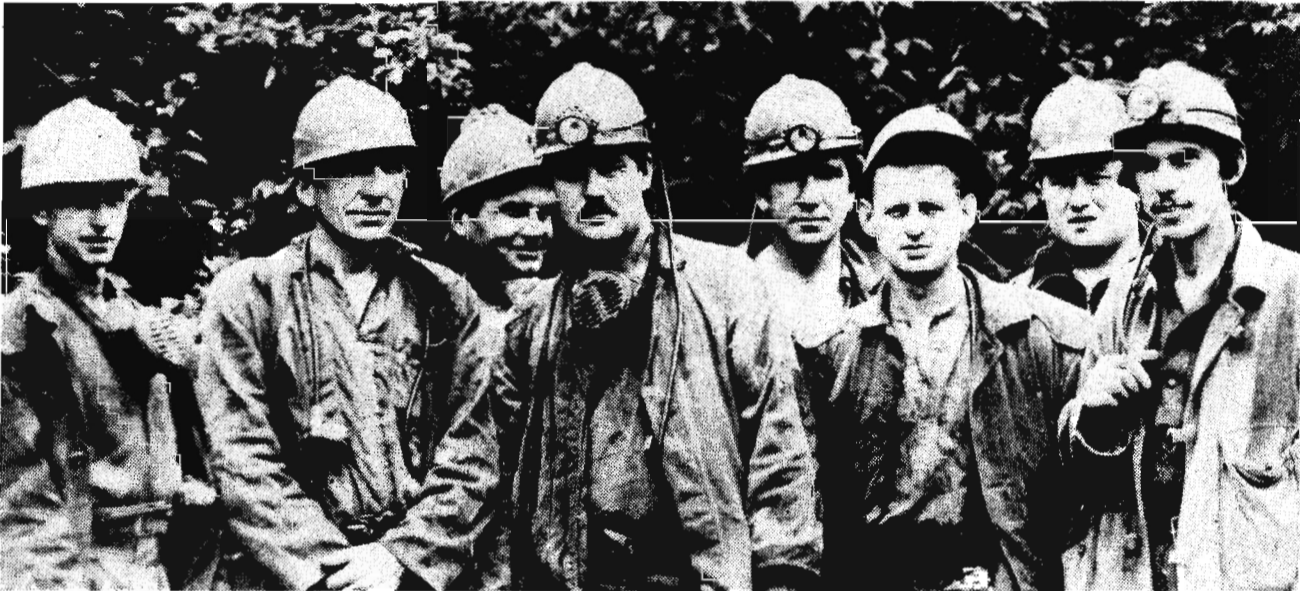
Успешно поработал в августе коллектив очистного участка № 3 шахты «Комсомолец». Горняки справились с поставленной перед ними задачей и

выдали на-гора дополнительно к плану 2288 тонн угля.