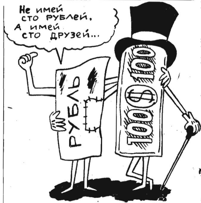
Рисунок Е. ЗАЙЦЕВА.

В противном же случае, как дали редакции разъяснение в горэлектросети, Задорожные могут написать заявление на имя главного инженера предприятия, и если Рязанов не будет рубить дерево, его отключат, будет сидеть без света. Вот так.