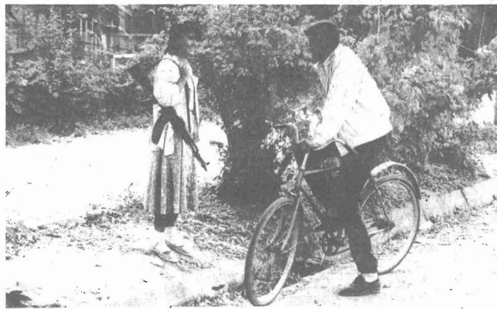
На улицах Душанбе жизнь продолжается.

Новоспасский — один из четырех действующих мужских монастырей в Москве. Есть в столице и действующий женский монастырь. Это не так уж и много для 9-миллионного города. Но, может, не в количестве дело? «Ночью, когда идешь по монастырскому двору, — говорит отец Илья, влюбленный в природу и сохранивший и после пострига увлеченность ботаникой и зоологией, — шума города почти не слышно и огней его из-за стены обители почти не видно. Зато звезды на небе видны ясно и далеко. И очень четко видно также, как наш древний храм с трехъярусной колокольней уходит своим шпилем, напоминающим ракету, во вселенскую бездну».