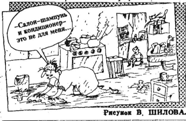
Рисунок В. ШИЛОВА.

малось». — рассказывает Н. С. Гареева, часто пользующаяся услугами этой прачечной.