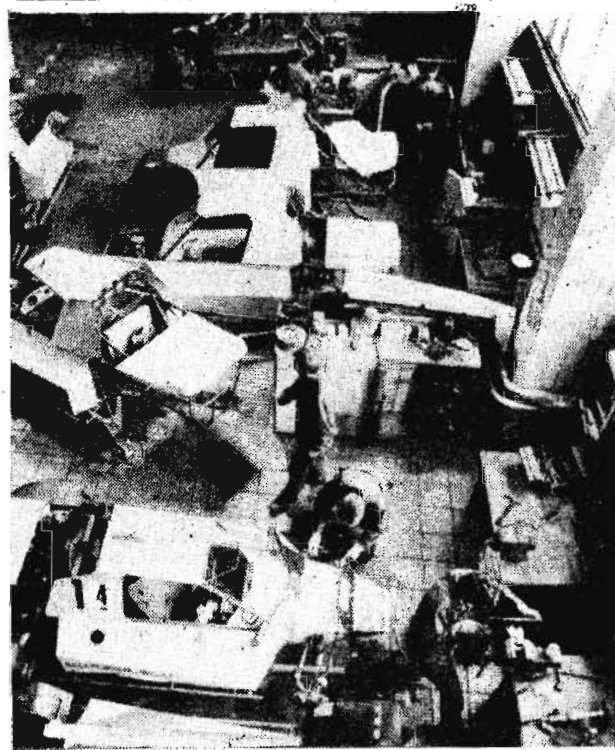
ТАТАРСТАН. Автомобили типа «Багги» самых разных классов конструируют и собирают в научнотехническом центре акционерного общества «КамАЗ». На этих машинах завоевано множество призов на чемпионатах разного уровня. Благодаря оригинальной конструкции и высокой надежности камазовских «багги» на предприятии поступают индивидуальные заказы на их изготовление от спортсменов разных регионов СНГ, для чего создана фирма «Стерус». Вырученные от продажи заказных машин средства идут на развитие автоспорта на «КамАЗе».

— Что ж, успешной вам работы! Беседу вел С. БЕЛОВ.