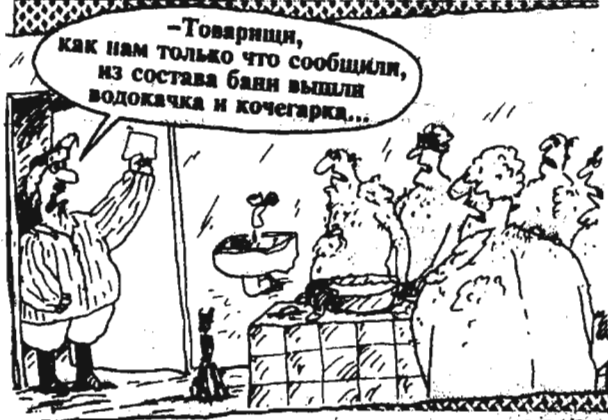
Рисунки В. ШИЛОВА.