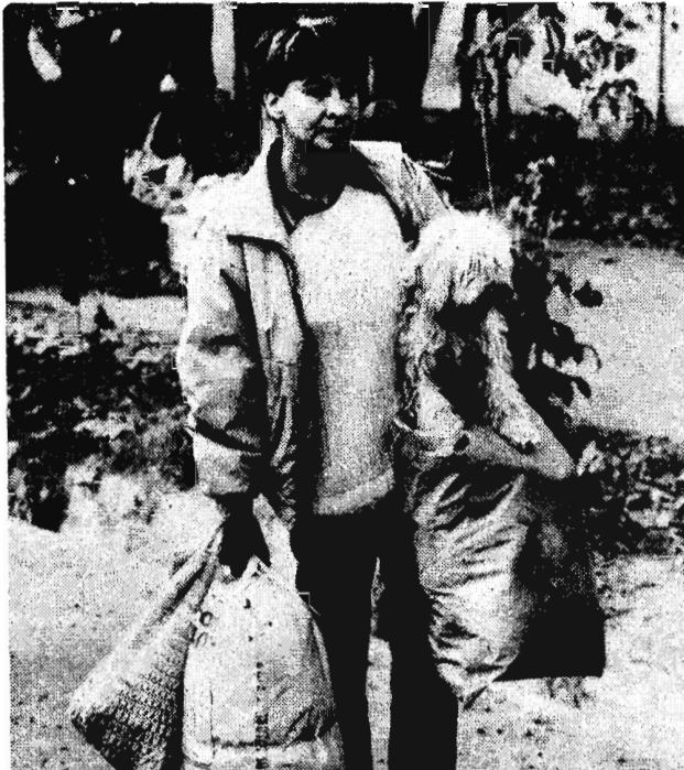
ТАДЖИКИСТАН. Здесь насчитывается сейчас более полумиллиона беженцев. Только в Душанбе их около 100 тысяч. Проблема размещения и снабжения продовольствием людей с каждым днем становится острее. На снимке: беженка.

Привет тебе, мой сумасшедший Всеобольщающий мир, Герой сегодняшних сатир, Как, впрочем, и во днях прошедших. Привет, привет, я был скитальцем, Душой и мыслями не чист. И, как пещерный дарвинист, Грозился в небо грязным пальцем. Но в круге жизни много граней И много нужно открывать В самом себе, чтобы понять: Мой дед не ближе к обезьяне. Я стал не тем, я к свету чалою В библейской лодке бытия. И, как ни грустно, знаю я: Во многом множество печалей. Но страх убит, а вольным воля, Ведь многие, как я, не те. И то, что пели в темноте. Мы ярким днем поем на кровлях. И звук растет, как снежный колоб, Но вдруг — в предчувствия молчим... Нам зов с небес необъясним, Как в чистый сон слетевший голубь. Вл. ЩЕРБИНИН.