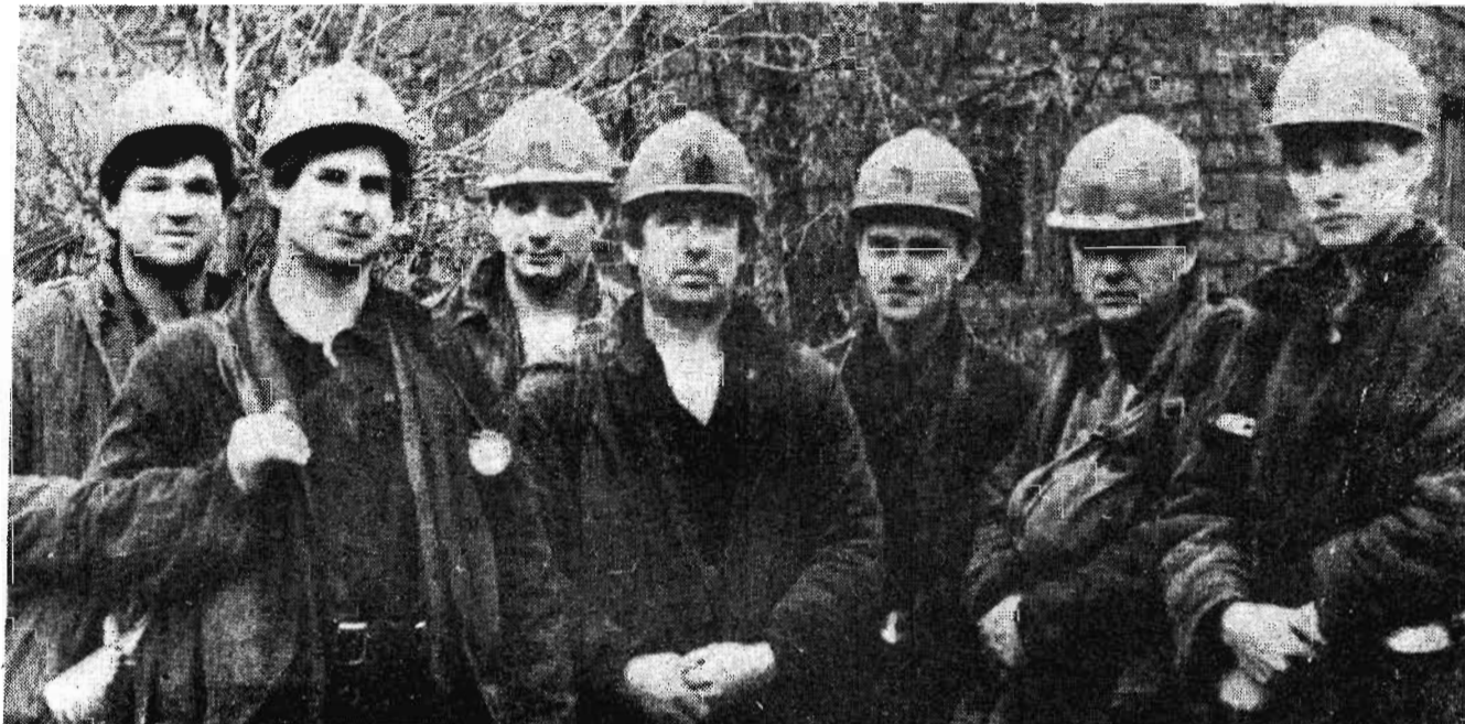
Производительно работает в ноябре коллектив очистного участка N 7 шахты "Комсомолец". Отработавшая лаву N 17-12 по пласту Бреевскому горняки за 14 дней этого месяца добыли более 26 тысяч тонн угля, из которых 8725 тонн записано на

Ю. ХМЕЛЬНИЦКИЙ, Тренер команды "Полысаевец"