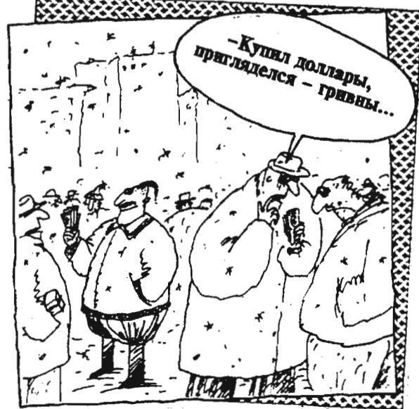
Рисунки В. ШИЛОВА.