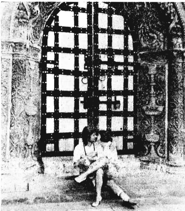
У врат блаженства