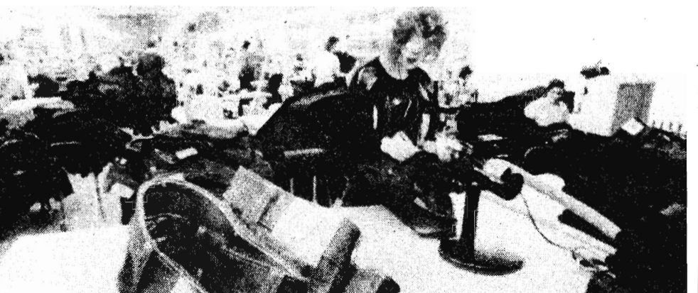
Санкт-Петербург. Куртки, рубашки, брюки с известной маркой «Мустанг» — продукция нового совместного российско-германского предприятия по пошиву джинсовой одежды «Мустанг Невы АО». На взаимовыгодных условиях организовали эту фирму швейное объединение «Труд» и германское предприятие «Мустанг». Первое предоста-

«Осовремененная» заработная плата шахтеров, ушедших на пенсию по старому закону о пенсиях, несмотря на повышение пенсий в процентном отношении к зарплате (75 процентов — по новому законодательству вместо 40—50 процентов — по старому) не позволяет иметь максимальный размер пенсии. По какой методике определялся коэффициент «осовременивания» заработной платы прошлых лет — непонятно. Ясно одно: что касается пенсионеров-подземников, то этот коэффициент не учитывает изменений зарплаты шахтеров. Ведь за восьмидесятилетие произошло несколько повышений тарифных ставок и окладов шахтеров, сняты ограничения сумм для начисления районного коэффициента, увеличен сам районный коэффициент, увеличился отпуск, введена доплата за время передвижения (доставки) к месту работы и т. д. Ничего этого