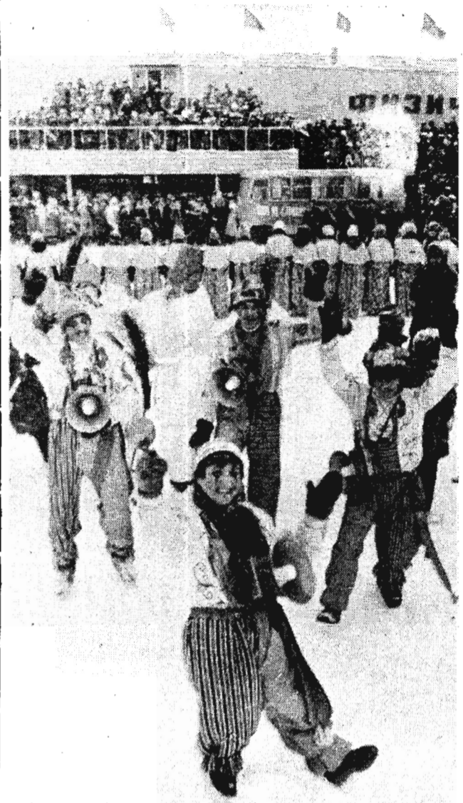
Масленица — праздник славянских народов. В этот день по древнему обряду провожают зиму: чтобы она не помнила зла и, уходя, не нарушила радость обновления, встречи с весной. На снимке: как не поддаваться озорному веселью скоморохов!