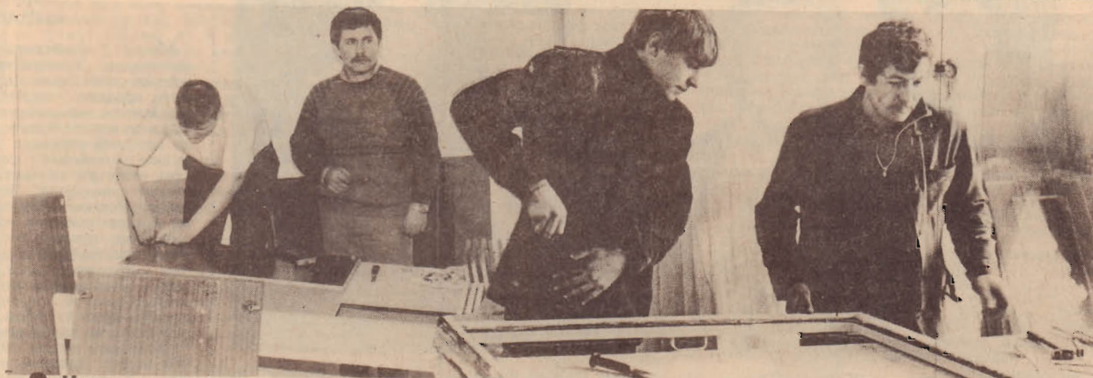
● На строительстве школы