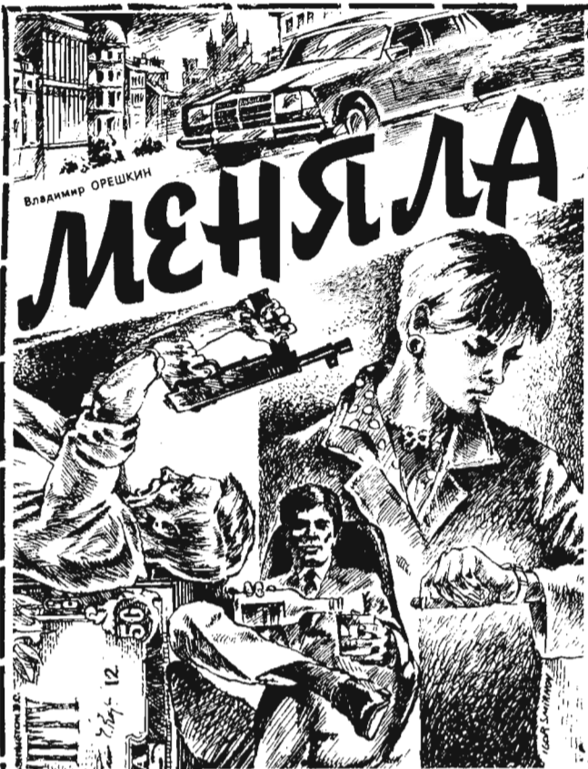
(Начало в № 31).

Бывший подземный рабочий шахты имени Ярославского, пенсионер с 1986 года.