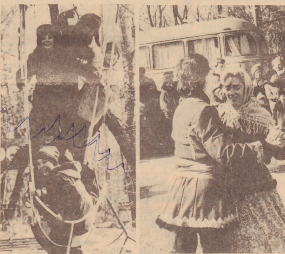
Весенним воскресным днем в парке

25 марта 1993 года начинается снижение уровня Беловского водохранилища, ввиду чего расход воды через водослив плотины увеличится.