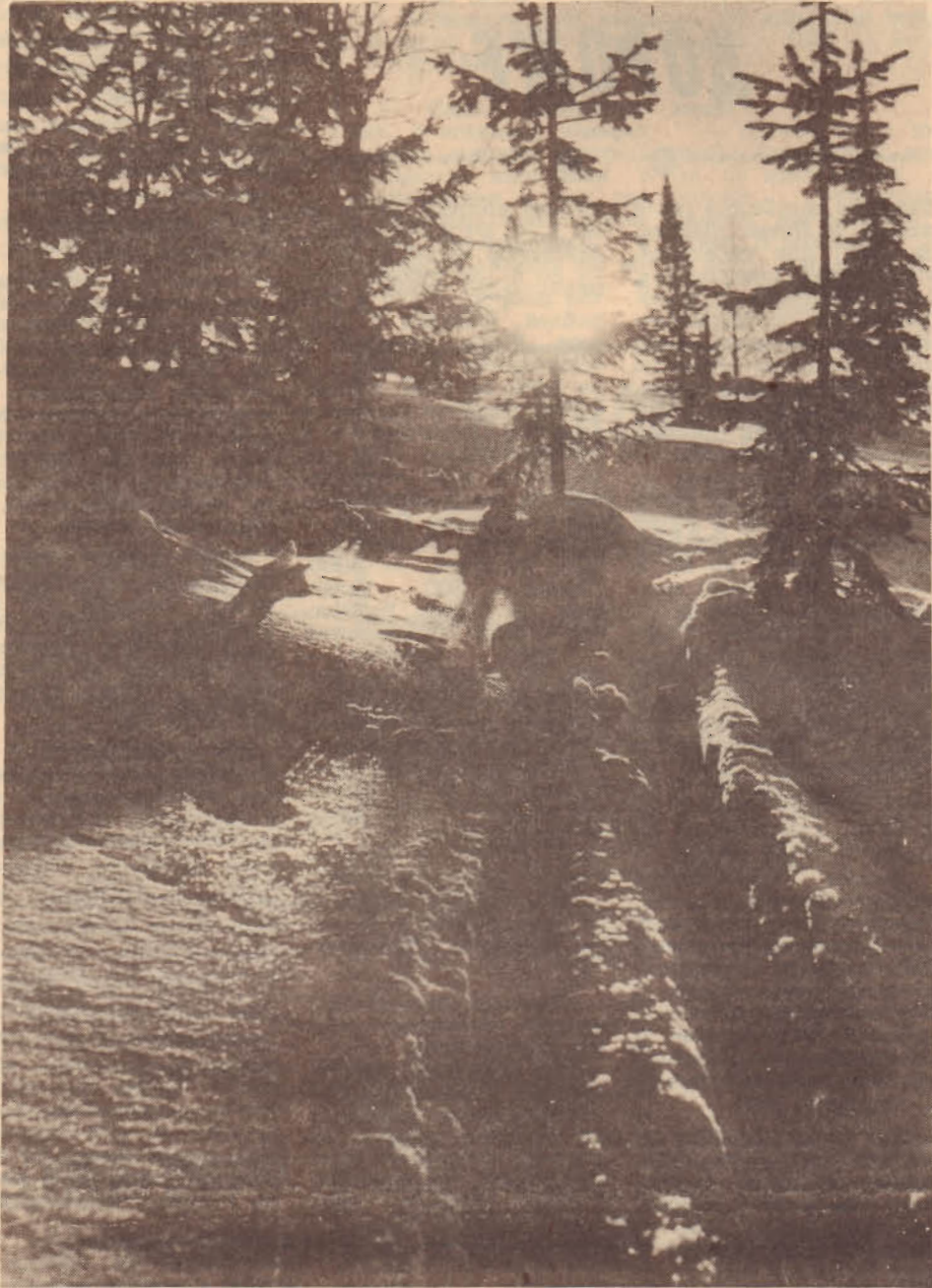
В зимнем лесу.