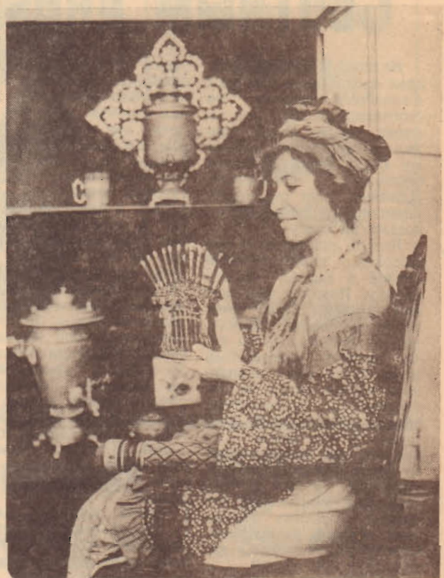
САМАРА. В областном музее краеведения открылась выставка самоваров. Кроме изделий знаменитых тульских и московских фабрик, на ней экспонируются самовары из стран Восточной и Западной Европы конца прошлого и начала XX века.

Один из разделов выставки посвящен предметам, сопутствующим чаепитию, — это и сахарницы, и специальные щипцы для раскалывания сахарных головок, и многое другое. Здесь же посетители могут получить старинные рецепты заварки чая, полезные советы, для любителей сувениров представлены изделия самарских мастеров декоративно-прикладного искусства.